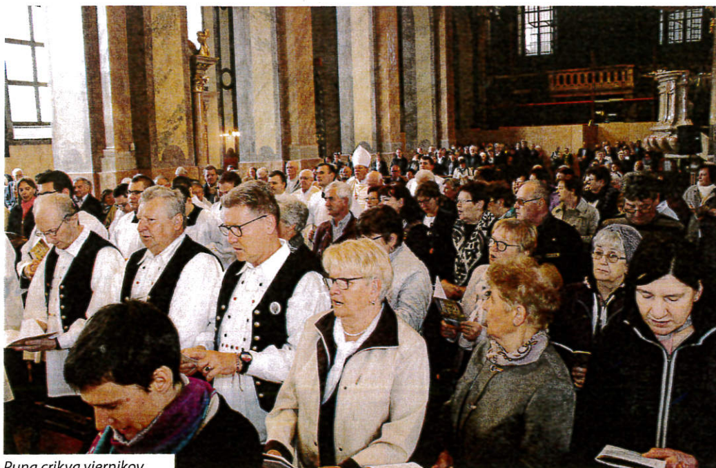
Puna crikva vjernikov