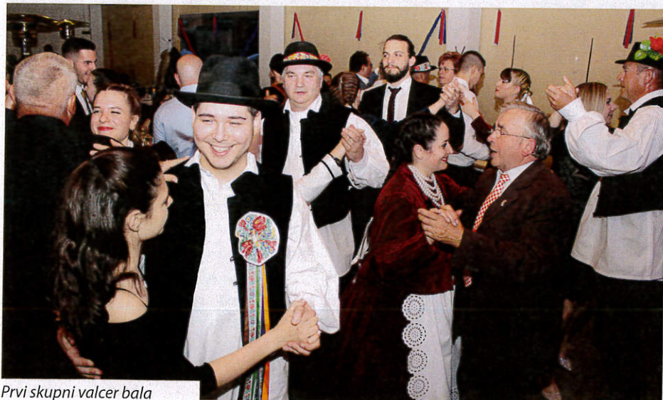
Prvi skupni valcer bala

Voditelj je rekao da Hrvatsko kulturno društvo je utemeljeno davnoga 1974. ljeta, odonda djela kontinuirano, prlje su bile kraće-duže stanke. Na plesnom repertoaru jednako su tanci matične zemlje, Hrvatske kot i koreografije Gradišća, a Undanci su majstori u insceniranju narodnih običajev. Ljetos su jur pozvani na pet mjesti u Hrvatskoj, na turneju u augustušu u Makedoniju, a to će se nek