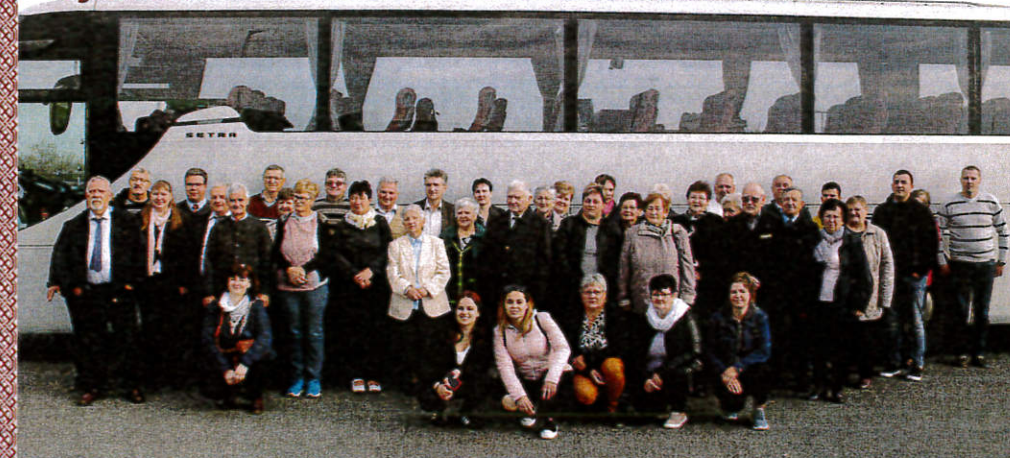
Hodočasnici iz Prisike, Hrvatskoga Židana i Unde