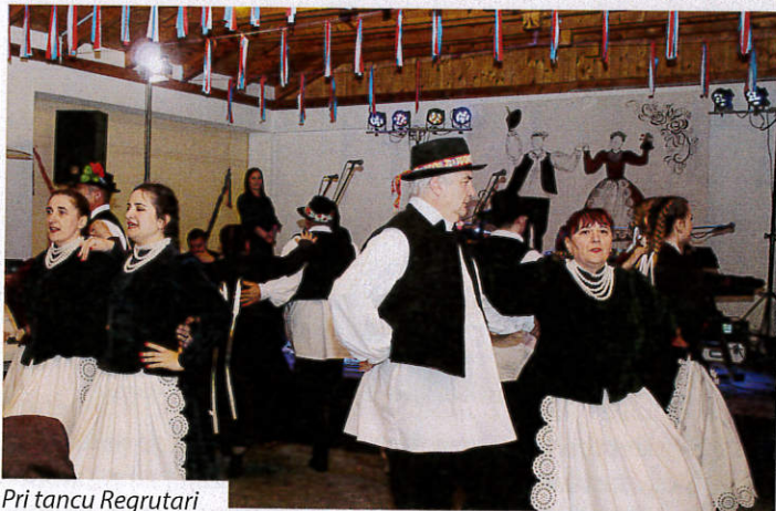
Pri tancu Regrutari