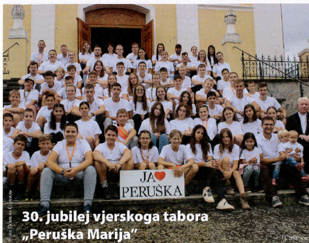
30. jubilej vjerskoga tabora „Peruška Marija“