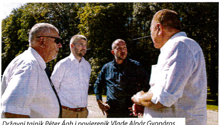
Državni tajnik Péter Ágh i povjerenik Vlade Alpár Gyopáros

đarskoj u malim mjestima još uvijek žive zajednice koje njeguju tradicije, koje se u poteškoćama slože i međusobno si pomažu, a u tim nastojanjima želi im pomoći i mađarska Vlada. Državni tajnik Péter Ágh izrazio je nadu da će hrvatski dom često biti mjesto susreta mještana, kulturnih grupa i drugih. U Prisiki se za njegovanje kulture, tradicija i običaja brine Hrvatsko društvo za očuvanje tradicija i proljepšavanje sela „Zviranjak“ već gotovo trideset godina. U njegovim okvirima djeluju razne kulturne skupine: tamburaši, pjevači, plesači od dječje do umirovljeničke dobi, koji će zasigurno upotrebljavati prostorije novog hrvatskog doma. Nakon svečanog otvorenja društvenog doma slijedilo je uživanje u izvršnim tradicionalnim jelima i hrvatskom kulturnom programu. Lepinje i renovice pripremale su družine kako bi svatko okusio omiljena jela Prisičana. U kulturnom programu nastupili su pjevači KUD-a „Zviranjak“ i plesna skupina KUD-a „Sumarton“.