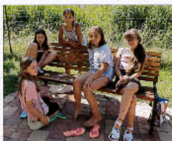
Kamp VII. okruga