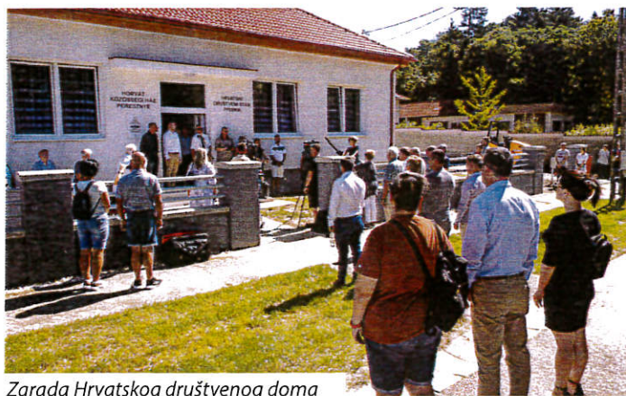
Zgrada Hrvatskog društvenog doma

Zgrada novog Hrvatskog društvenog doma do 1970. bila je osnovna škola, a zatim je prenamijenjena za ured pošte. Mjesna i hrvatska samouprava zajedničkim su snagama uspjele pribaviti sredstva da se zgrada u potpunosti obnovi i u modernom obliku ubuduće služi mještanima. Radovi obnove obavljani su u dva navrata. Naime, za potporu se prvo kandidirala mjesna samouprava Prisike, tad je dobivena potpora od 25 milijuna forinti, i od tih sredstava obnovljen je krov, izolirana fasada, promijenjeni su vanjski prozori i sanitarije, struja, grijanje. Za daljnje radove i obnovu interijera, uređenje kuhinje, oblaganje podova, bojenje i uređenje okoliša hrvatska je samouprava dobila potporu također od 25 milijuna forinti, a namještaj je nabavljen vlastitim sredstvima. Inače je Općina Prisika u ovom mandatu bila uspješna i na raznim drugim natječajima i uspjela je pridobiti sredstva od gotovo 300 milijuna forinti za razvoj mjesta, izjavio je načelnik Gyula Orbán. Među ostalim obnovljena je i cesta koja vodi do Hrvatskog Židana, što omogućuje sigurnije prometovanje između dvaju hrvatskih mjesta. Na svečanom otvorenju hrvatskog doma povjerenik Vlade Alpár Gyopáros istaknuo je kako u Ma-